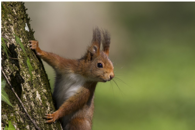
Écureuil roux

Noisette et cône de conifère mangés par un écureuil. Les noisettes sont cassées en deux parties souvent égales, tandis que les cônes sont arrachés à leur base et rongés de manière grossière, contrairement à ceux grignotés par d'autres rongeurs comme les mulots