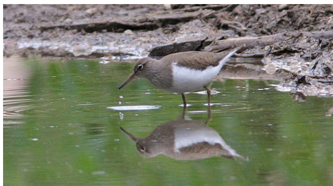
Chevalier guignette

C'est particulièrement le cas de certains limicoles, pour lesquels le mois de juillet représente non seulement les premiers mouvements, mais aussi le pic de migration. On peut citer notamment l'Echasse blanche, les Chevaliers culblanc, sylvain et guignette.