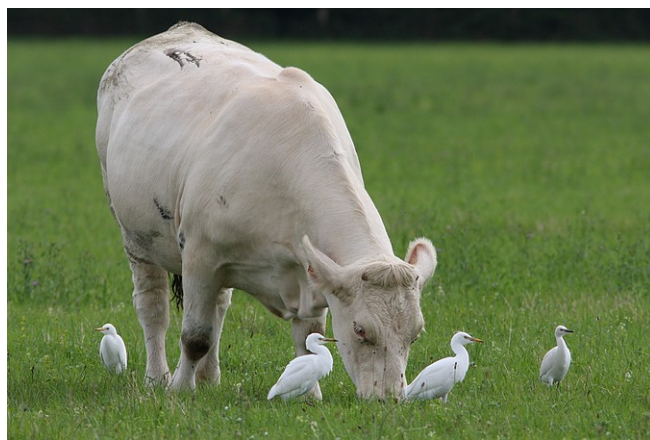
Hérons garde-bœufs

S'il est bien une espèce dont les observations ont littéralement explosées en l'espace de quelques années en Côte-d'Or, c'est le Héron garde-bœufs. Ce petit ardéidé cosmopolite, encore si rare chez nous au début des années 2000, donne désormais lieu à plusieurs mentions chaque année, notamment au cœur de l'été. Des groupes de plusieurs dizaines d'individus (record à battre : 57 !) ne sont même plus exceptionnels. L'oiseau porte bien son nom, et les zones de prairies pâturées seront à privilégier pour partir à sa recherche, ainsi que la proximité des zones humides. Sans surprise, c'est ainsi le val de Saône (étendu à la Vingeanne au nord et à la Dheune au sud) qui concentre la majorité des données. Mais les gravières de plaine dijonnaise ou les environs des réservoirs de l'Auxois, par exemple, peuvent également accueillir le petit héron.