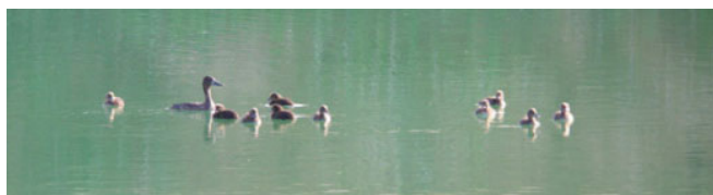
Fuligule morillon, femelle et canetons

Si le mois de juillet vous permet encore de mener des prospections « oiseaux nicheurs » pour de nombreuses espèces (Bondrée apivore, Pies-grièches écorcheur et à tête rousse, hirondelles, Circaète Jean-le-Blanc, Fuligule morillon, Nette rousse, Blongios nain, passereaux entamant leur seconde nichée, etc.), il marque également le début de la migration post-nuptiale (la descente vers le sud) pour quelques espèces.